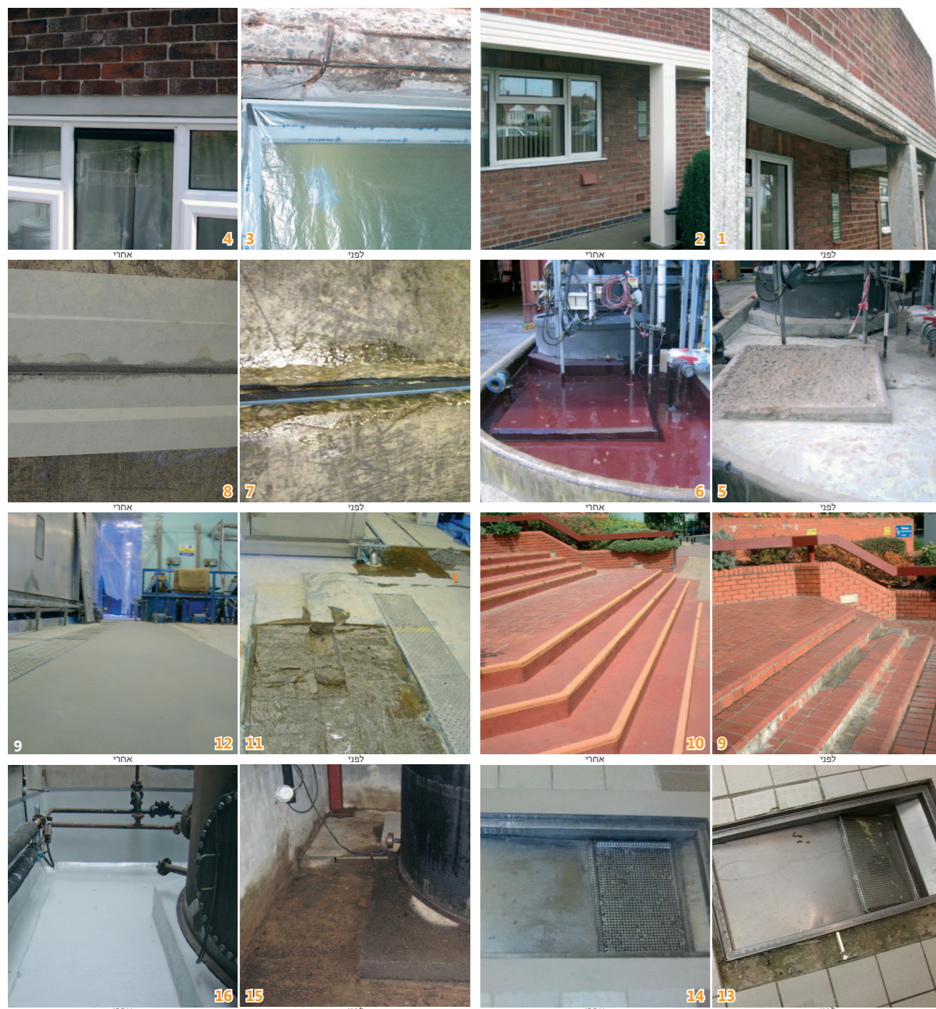
1 & 2 בטון מפוצל 3 & 4 תיקון משקופים 5 & 6 אזורי אצירה של חומרים כימיים 7 & 8 מחברי התפשטות 9 & 10 מדרגות ואפי מים 11 & 12 דיוס מחדש של משטחי רצפות שניזוקו או התבלו 13 & 14 מחילות וסורגים 15 & 16 אזורי סוללות מקבילות